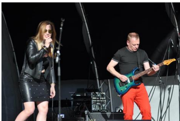
Solistka Revolfighter

REVOLFIGHTER - Dla młodych nie zabrakło uderzenia rockowego, w które zabezpieczył nas trzy osobowy zespół z Polski.