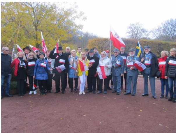
Uczestnicy podczas przygotowania do Biegu

Bieg Niepodległościowy POLAND RUN 1918 . Odbył się w dwóch kategoriach: Bieg i Spacer.