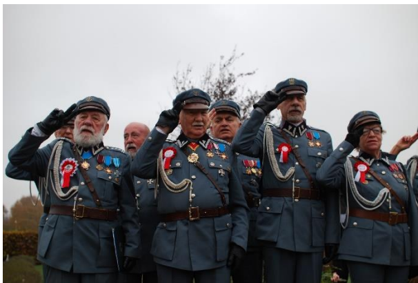
Piłsudzczy z Krajowego Zarządu RP