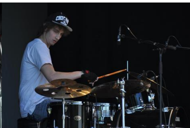
Perkusista Revolfighter – Photo: ©Polka & Sebastian Tomaszewicz 2018