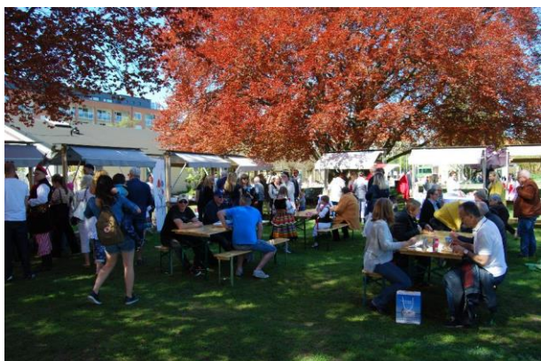
Stoiska z polskimi przysmakami

Podczas festynu były stoiska z polskimi przysmakami i sprzedażą polskiego szkła dekoracyjnego. Stoiska cieszyły się wielką popularnością i były bardzo oblegane przez odwiedzających.