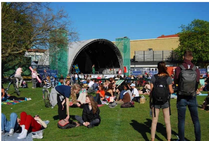
Mieszkańcy Malmö podczas obchodów 100 Rocznic