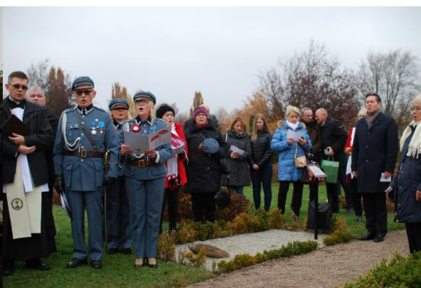
Zakończenie uroczystości