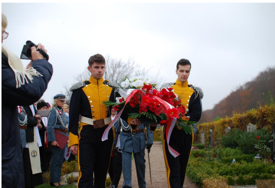
Ulani z Zespołu Piosni i Tańca Politechniki Warszawskiej