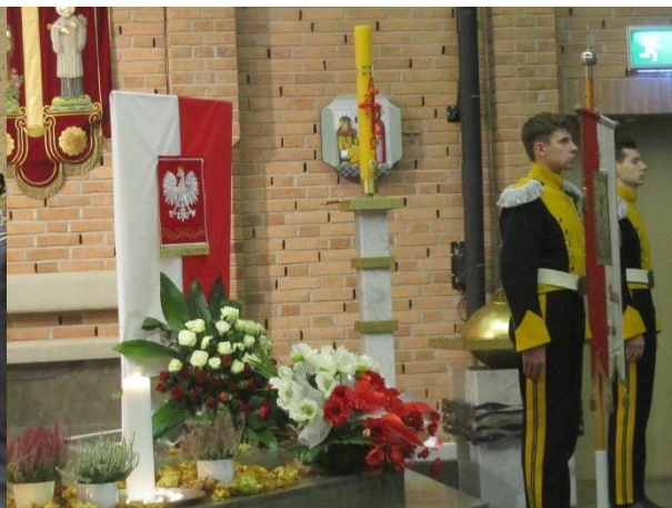
Ulani z Zespołu Piesni i Tańca Politechniki Warszawskiej przy standardzie Polonii – Photo: ©Polka & Sebastian Tomaszewicz 2018

Po Mszy wszyscy udaliśmy się na wspólny obiad do Restauracji w Malmö. Tam też punktualnie o godz.12.00 przy pełnej innej gości odśpiewaliśmy Hymn. Wzbudziliśmy ogromne zainteresowanie mundurami Piłsudczyka. Padało wiele pytań, na które z chęcią głośno odpowiadaliśmy. Ku naszemu zdziwieniu wiele osób wiedziało o Polsce i zdobyciu wolności pã 123 latach.