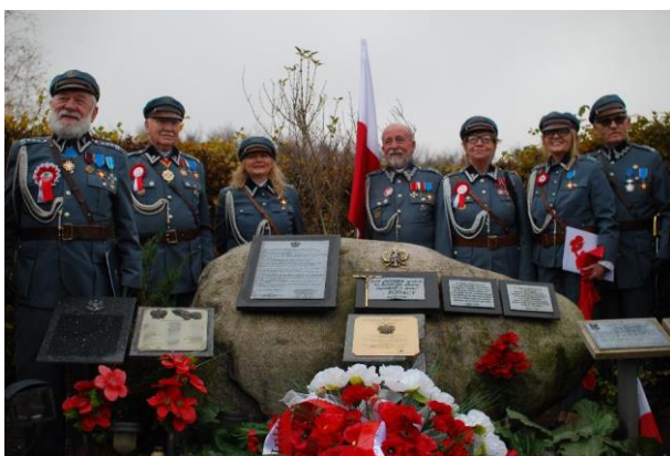
Piłsudzczy przy Obelisku Pamięci Narodowej na cmentarzu Rosengård w Malmö kv.nr 5