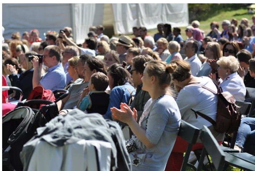
Publiczność – Photo: ©Polka & Sebastian Tomaszewicz 2018

Dziękujemy publiczności, że w tym dniu ważnym dla Polski i Polaków byliście z nami!