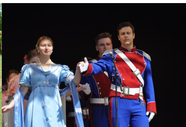
Ognisko Kwiaty Polskie – Photo: ©Polka & Sebastian Tomaszewicz 2018