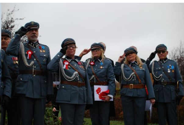
Piłsudzczy Krajowego Zarządu RP i z oddziału Szwecja