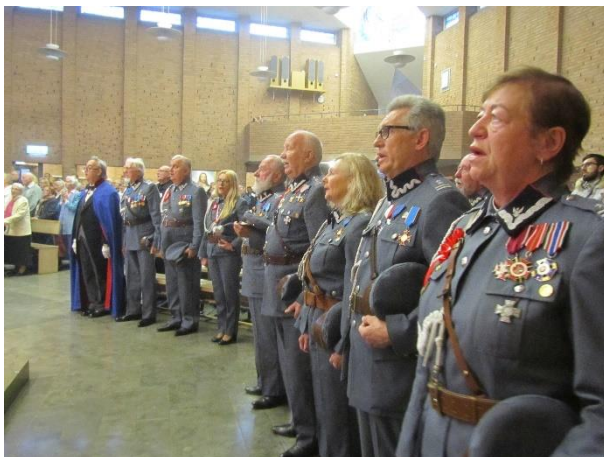
Piłsudczyki podczas Mszy Świętej z okazji 100 Rocznic w kościele katolickim w Malmö