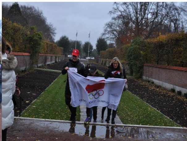
Na metę dochodzą uczestnicy Biegu z flaga PKOl