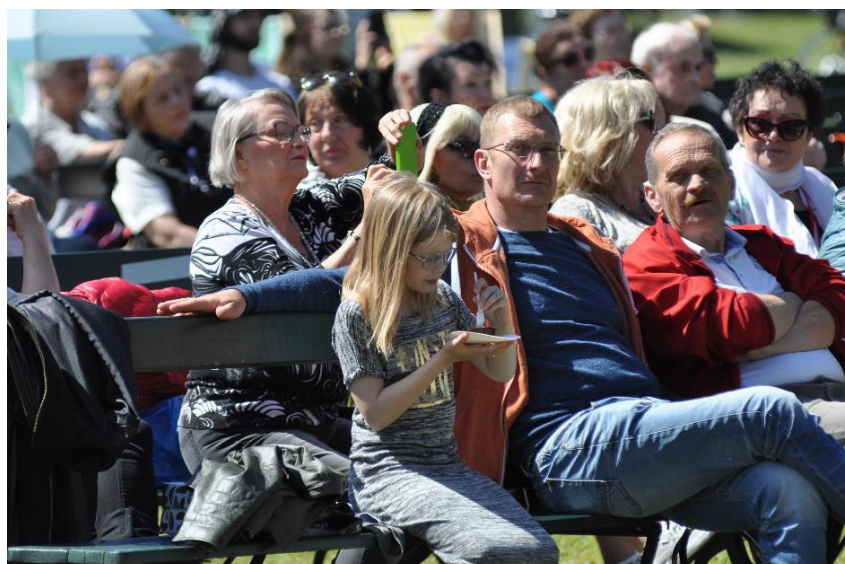
Najmłodszy też byli z nami